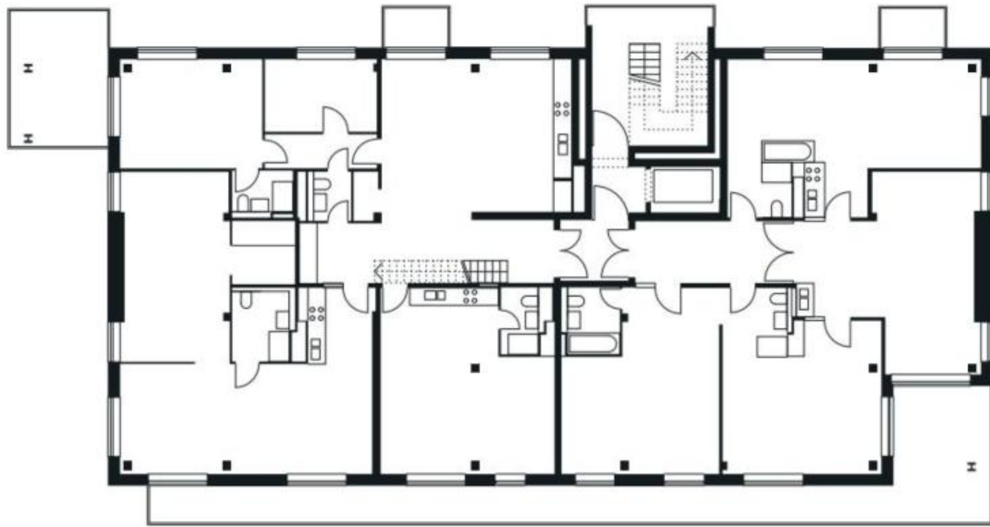
Abb. 67 1. Obergeschoss