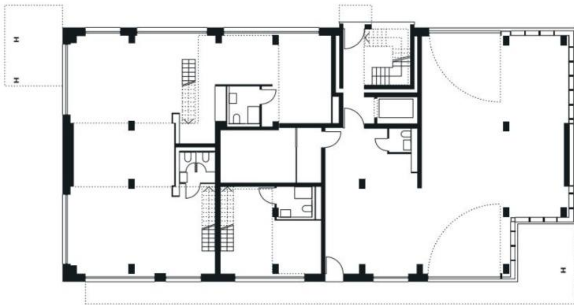
Abb. 68 Erdgeschoss